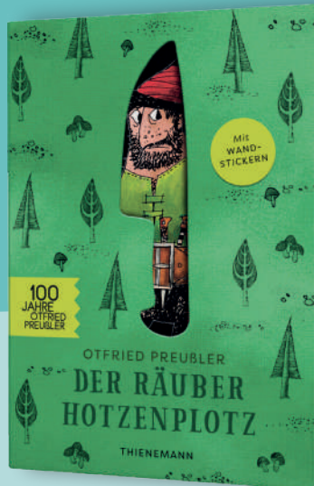
Der Räuber Hotzenplotz ISBN 978-3-522-18641-4 · 18,00 €

Limitierte Jubiläumsausgaben mit hochwertigen Wandstickern und Coverstanzung