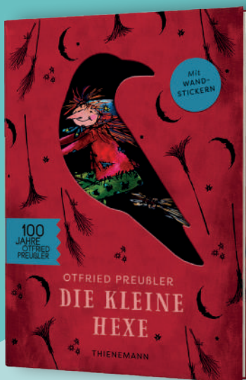
Die kleine Hexe ISBN 978-3-522-18642-1 · 18,00 €