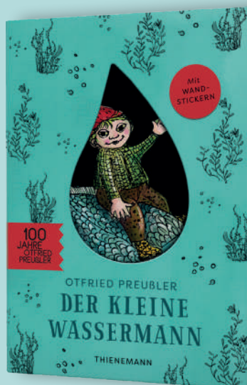
Der kleine Wassermann ISBN 978-3-522-18643-8 · 18,00 €