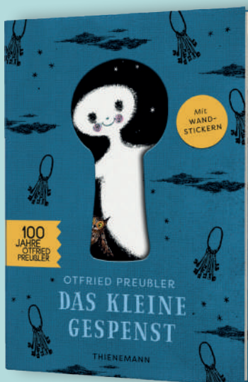
Das kleine Gespenst ISBN 978-3-522-18644-5 · 18,00 €

Limitierte Jubiläumsausgaben mit hochwertigen Wandstickern und Coverstanzung