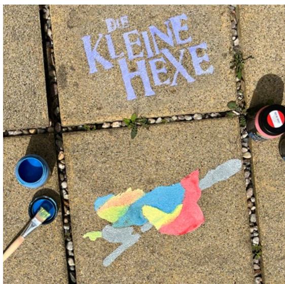
Noch cooler wird's mit vielen Farben...

Alles, was Euch stoppen kann, ist Eure eigene Kreativität!