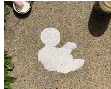
...fertig - sieht doch cool aus!

Natürlich könnt ihr auch Eurer eigenen Kreativität freien Lauf lassen und ohne Schablonen die vielfältigen Charaktere wie Kasperl und Seppel oder den treuen Raben Abraxas malen.